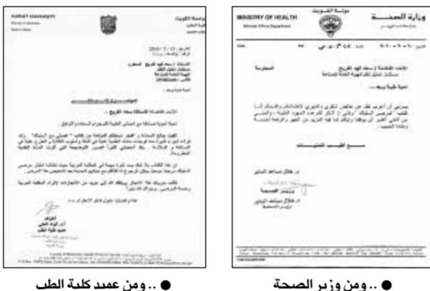
ومن وزير الصحة .. ومن عيد كلية الطب