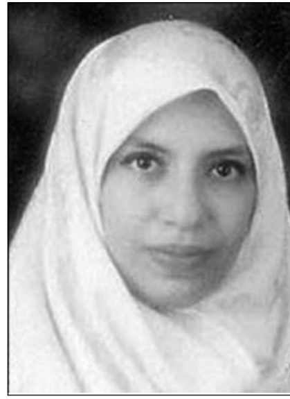
وفي.. بعد ٨٥ عامًا تخرجها من الجامعة