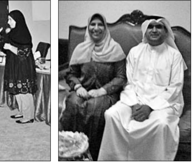
مع زوجها في ضيافة «الشاهد»