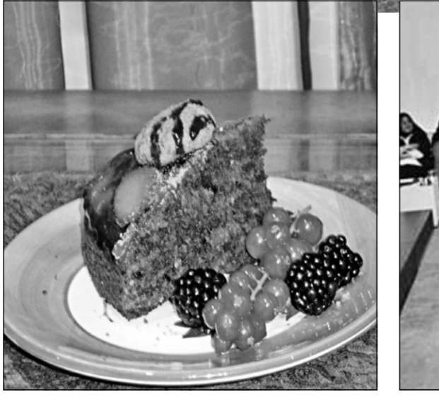
كعك من دون جلوتين