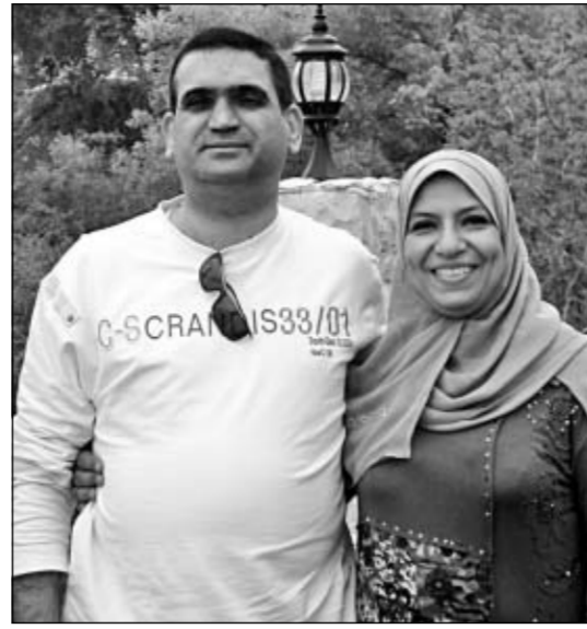
ومع زوجها في بيروت