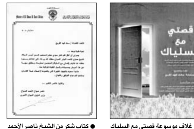
غلاف موسوعة قصتي مع السلياك .. كتاب شكر من الشيخ ناصر الأحمد