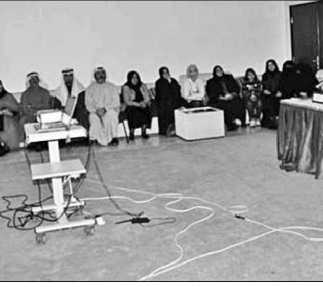
الفريح في إحدى ندواتها التوعوية